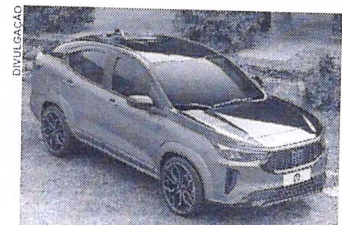
Carro conceito recebeu acessórios originais e também itens de personalização exclusivos, reforçando a esportividade e sofisticação do Fiat Fastback